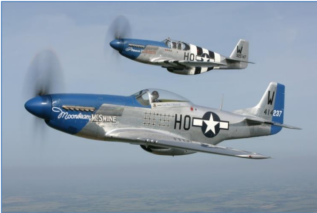
Sylvester Evans vloog in een toestel zoals deze hierboven.

Toen zij zagen dat Sylvester veilig was uitgestapt, beschoten zij het gelande vliegtuig.