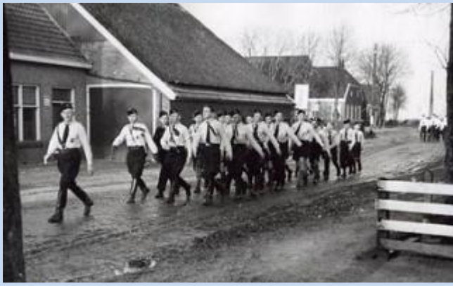
• NSB jongeren marcheren door Drenthe

Al voor de oorlog had de NSB aardig wat leden. Ook mensen in Zuidoost Drenthe voelden zich aangetrokken tot de partij. Veel van hen geloofden de ideeën, maar er waren ook mensen lid geworden omdat ze dachten dat de NSB beter voor hun kon zorgen. Er was namelijk sprake van een heftige economische crisis in de jaren dertig en veel mensen waren werkloos en veel boeren waren erg arm.