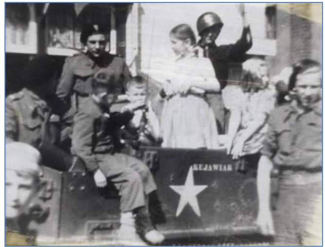
• Poolse tank in Drenthe

Maar op 9 april trokken Duitse colonnes 's avonds weg richting Odoorn.