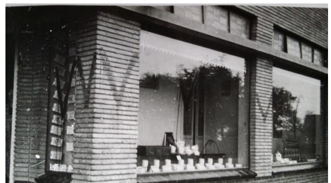
Huis van een Duitsgezinde is besmeurd met verf. In deze winkel zit nu sportschool Extension

Al voor de oorlog had de NSB aardig wat leden. Ook mensen in Zuidoost Drenthe voelden zich aangetrokken tot de partij. Veel van hen geloofden de